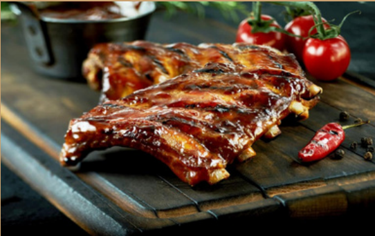
TRAVERS DE PORC