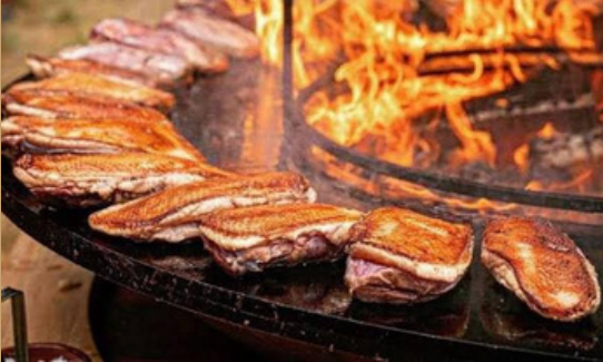
MAGRET DE CANARDS