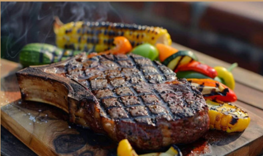
CÔTE DE BOEUF